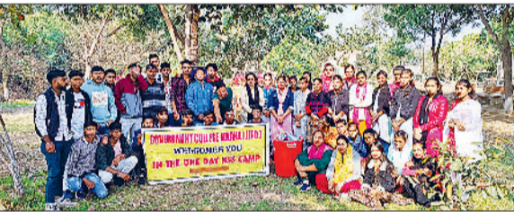
जुलाना। कार्यक्रम के तहत सफाई अभियान चलाते स्वयंसेवक।