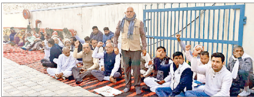
जींद। मांगों को लेकर धरने पर बैठे पार्षद।