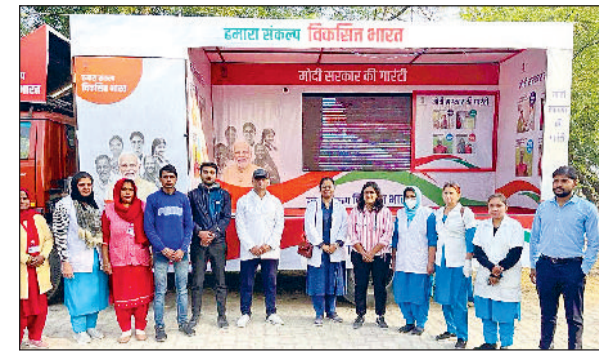
अलेवा। रायचंदवाला गांव में पहुंची स्वास्थ्य विभाग की टीम।