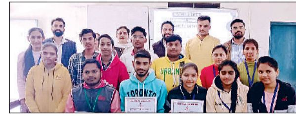
जीद। प्रतियोगिता में विजेता रहे छात्र।