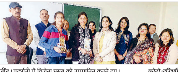
जीद। प्रदर्शनी में विजेता छात्रा को सम्मानित करते हुए।