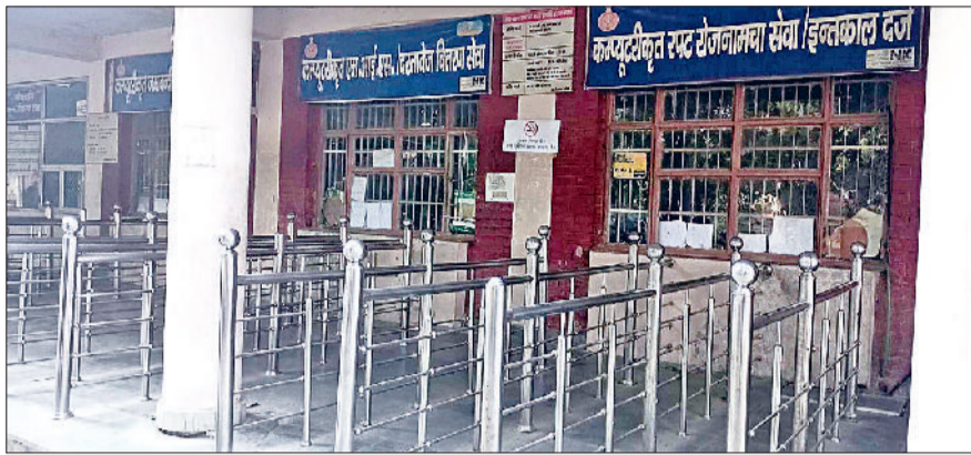
जीद। खाली पड़ा तहसील परिसर।

एसे में हड़ताल के चलते ई-दिशा केंद्र में सभी कार्य ठप रहे। जिसके चलते आमजन को परेशानी का सामना करना पड़ा। अपनी मांगों को लेकर मंगलवार को डीआईटीएस के तहत आने