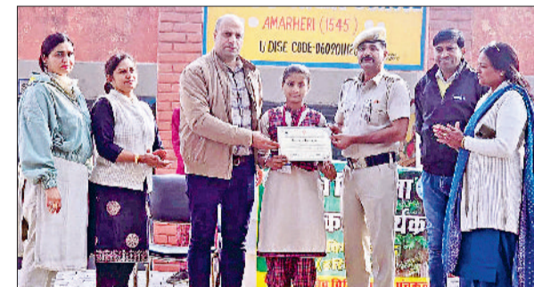
जीद। बच्चों को सम्मानित करते हुए।