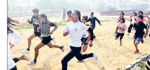
कैथल। दौड़ प्रतियोगिता में दमखम दिखाती खिलाड़ी।

आयोजन रमन व रिम्म अस्पताल कैथल द्वारा पुलिस के सहयोग से करवाया गया। इस दौरान लड़के-लड़कियों को 100 मीटर, 400 मीटर, 800 मीटर व 1600 मीटर की रसे हुई। रस में अब्बल रहे प्रतिभागियों को सम्मानित किया