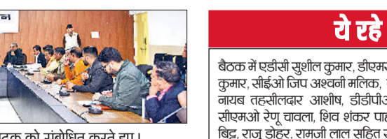
कैथल। डीसी प्रशांत पंवार अधिकारियों की बैठक को संबोधित करते हुए।

डीसी प्रशांत पंवार ने कहा कि आगामी 22 व 23 दिसंबर को गीता जयंती महोत्सव भव्य और गरिमा पूर्ण तरीके से मनाया जाएगा। इसके लिए सभी अधिकारी अपने-अपने विभागों से संबंधित तैयारियों समय रहते पूरी कर लें। भाई उदय सिंह किला परिसर में हवन यज्ञ से गीता महोत्सव की शुरुआत की जाएगी और इसी दिन प्रदर्शनी का उद्घाटन भी होगा, जिसमें विभिन्न विभागों द्वारा योजनाओं, परियोजनाओं संबंधित विषयों को लेकर स्टॉल