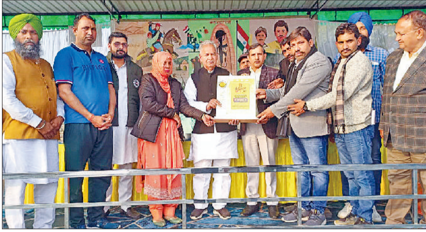
गुहला-चीका। विधायक ईश्वर सिंह जन संवाद कार्यक्रम में कर्मचारियों को सम्मानित करते हुए।

विधायक ईश्वर सिंह ने कहा कि सरकार बेरोजगारों को योग्यता के आधार पर नौकरी देने के अलावा आम जन तक कल्याणकारी योजनाओं का लाभ पहुंचा रही है। विकसित भारत संकल्प यात्रा-जन संवाद के माध्यम से लाभपत्रों को सरकारी सेवाएं उनके घर द्वार पर उपलब्ध कराने में सरकार अपना दायित्व निभा रही है। संकल्प यात्राओं का गांव-गांव में भव्य स्वागत हो रहा है और लोग इस दौरान आयोजित कार्यक्रमों में उत्साह पूर्वक सहभागिता बन रहे हैं। विधायक ईश्वर सिंह मंगलवार को गांव भागल व बलबेहड़ा में आयोजित विकसित भारत संकल्प यात्रा के दौरान लोगों को संबोधित कर रहे थे। विधायक ईश्वर सिंह ने सरकार की अंत्योदय की भावना से क्रियान्वित योजनाओं की सराहना