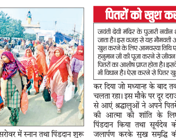
सरोवर में स्नान तथा पिंडदान शुरू

पांडु पिंडारा स्थित पिंडतारक तीर्थ पर मंगलवार को वर्ष 2023 की अंतिम भौमवती अमावस्या पर श्रद्धालुओं ने सरोवर में स्नान किया तथा पिंडदान कर पितृ तर्पण किया व सुखद भविष्य की कामना की। ऐतिहासिक पिंडतारक तीर्थ पर सोमवार शाम से ही श्रद्धालुओं का पहुंचना शुरू हो गया था। पूरी रात धर्मशालाओं में सतसंग तथा कीर्तन आदि का आयोजन चलता रहा। फिर मंगलवार को श्रद्धालुओं ने